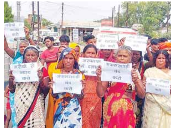
हरिभूमि न्यूज | दमोह

गर्मवती महिला को सही उपचार न मिलने के विरोध स्वरूप अस्पताल के बाहर प्रदर्शन