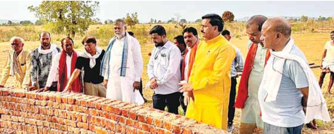
दमोह