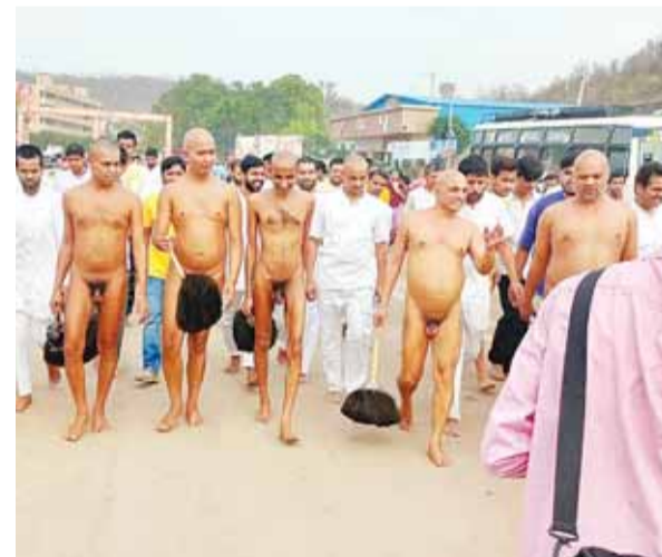
हरिभूमि न्यूज | कुंडलपुर