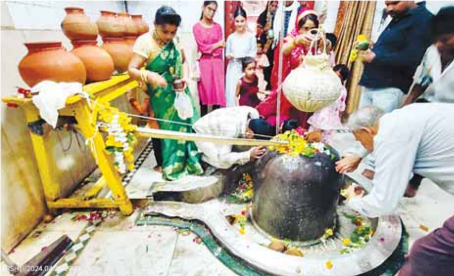
हरिभूमि न्यूज | बनवार

वैशाख माह के आरंभ होते ही सुबह से लेकर शाम तक देव श्री जागेश्वर धाम बांदकपुर धाम में भक्तों का ताता लगा रहता है। मान्यता है वैशाख माह में भगवान भोलेनाथ को जल चढ़ाने से